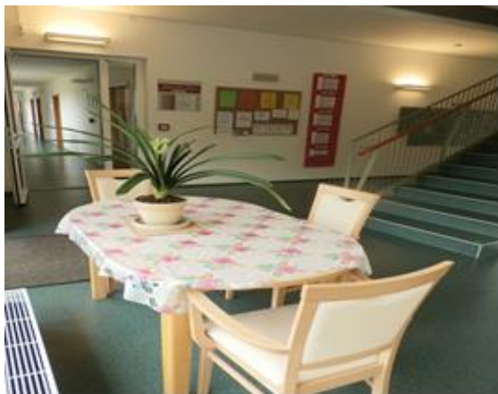
Respirium v budově D